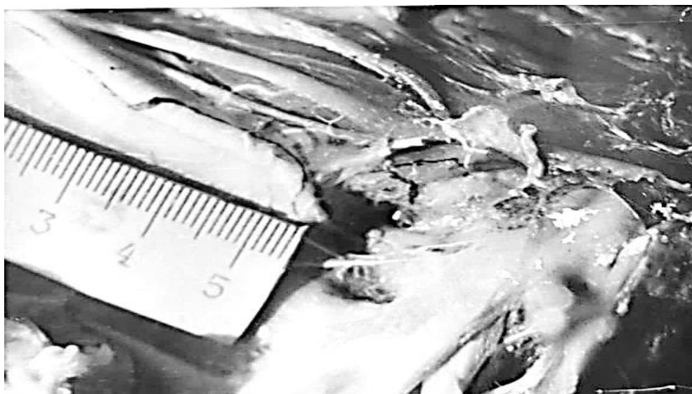
2-O`rta qon tomir-nerv tutami tarkibidagi limfa kollektor.